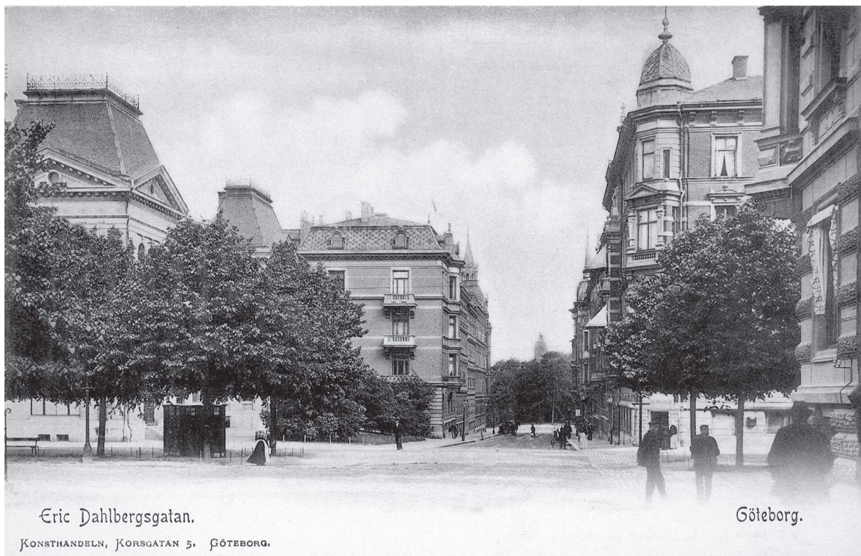
Äldre bild över Erik Dahlbergsgatan mot norr. Okänt årtal. Tv skymtar Betlehemskyrkan (d.ä.) och nedan Erik Dahlbergsgatan 9.