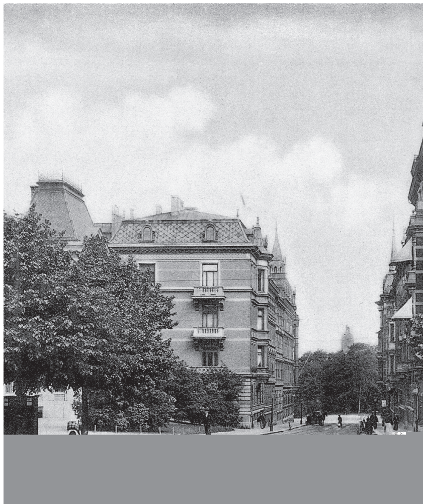
Äldre bild över Erik Dahlbergsgatan sett mot norr. Okänt årtal.