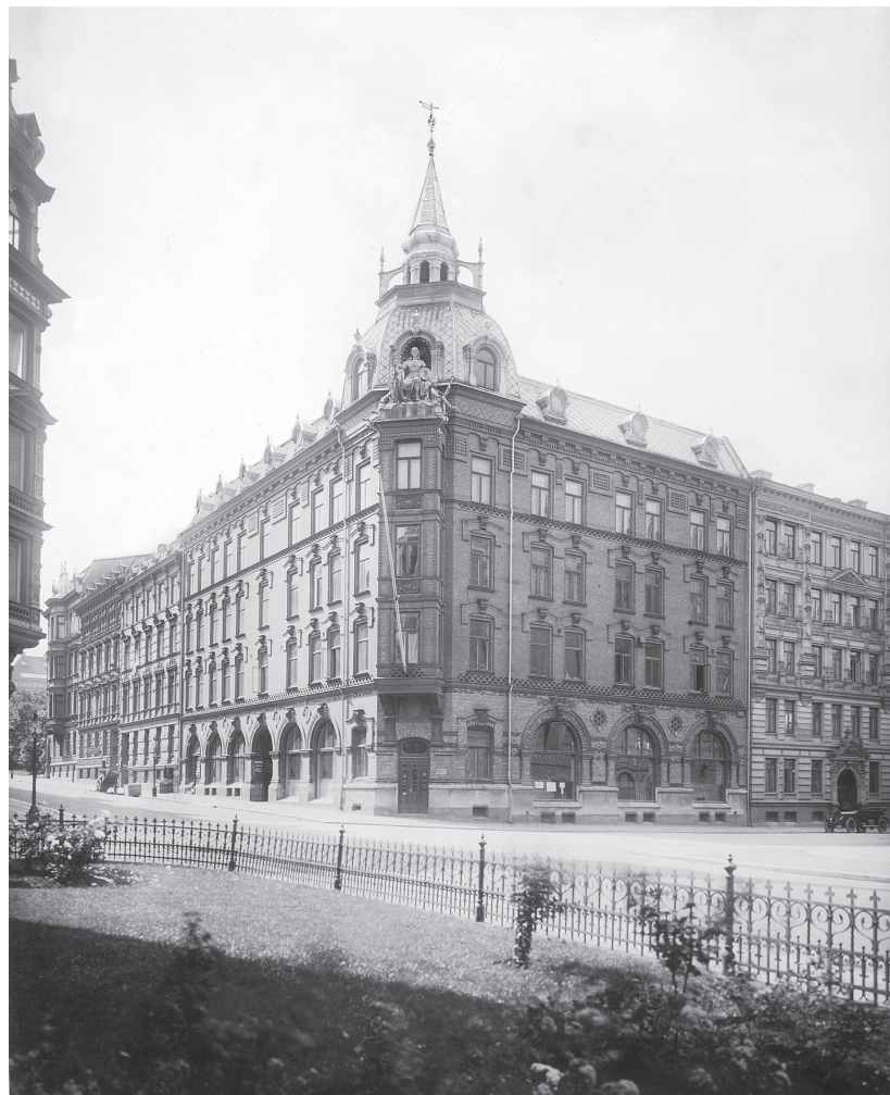
Äldre bild över Erik Dahlbergsgatan sett mot söder. Okänt årtal.